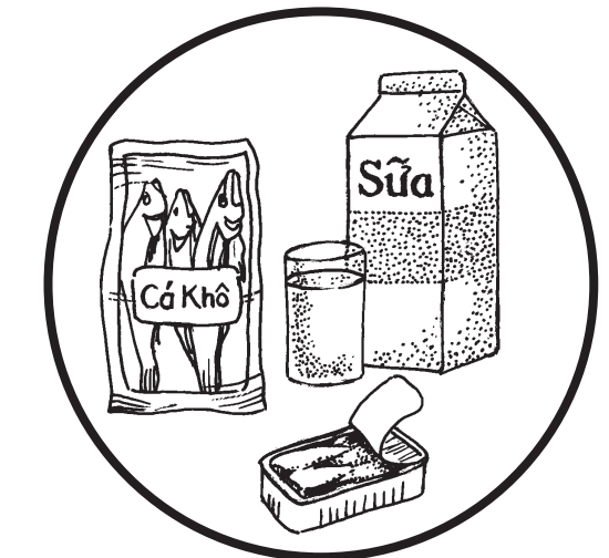
Sữa/Các thức ăn khác có nhiều chất vôi (can-xi) Milk/Other Calcium-Rich Foods