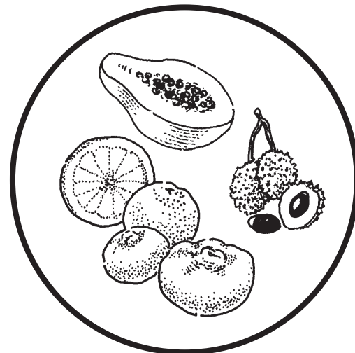
Trái cây Fruit