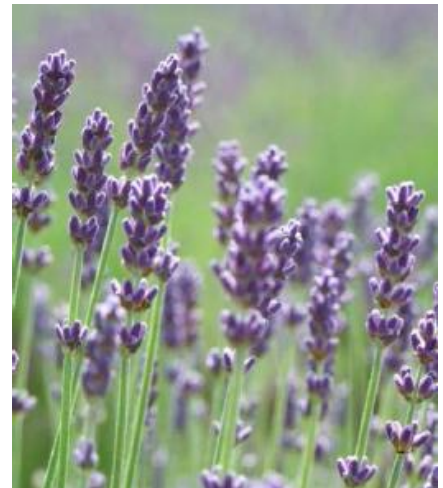
យើងសង្ឃឹមថាព័ត៌មានក្នុងអត្ថបទនេះមានប្រយោជន៍នៅពេលលំបាក។

វាអាចមានការយល់ច្រឡំពីព្រោះបេះដូងគេកំពុងនៅដើរហើយហាក់ដូចជាគេកំពុងដេកលក់។