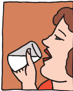
ሁልጊዜ ውሀ መጠማት