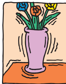
ብዥታ ያለው እይታ